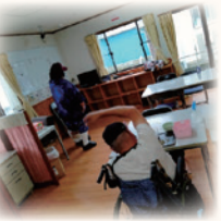
りのら喫茶店 デイサービス WAYWAY 様