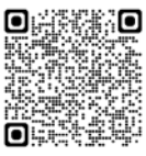
求人応募フォーム