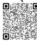
求人応募フォーム