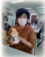
看板娘と一緒に・・・